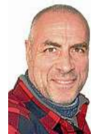
von Dirk Bohlen

Siehste - geht doch! Eindrucksvoll und ohne sichtbaren Stress hat das mobile Impfteam des DRK in Alpen vorgeführt, wie eine effektive Immunisierungsstrategie vor Ort auf die Beine gestellt werden kann.